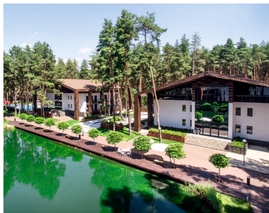
Отель Verholy Relax Park, Полтава