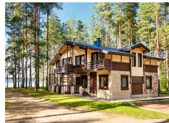
Отель «Лесная рапсодия», Зеленогорск