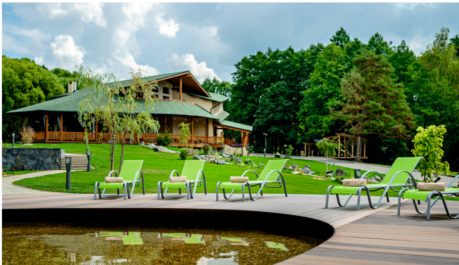
Отель Welna Eco SPA Resort, Таруса, Калужская область