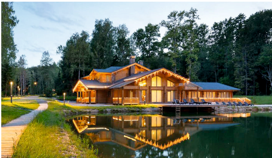
Эко-отель «Изумрудный лес», Подмосковьё