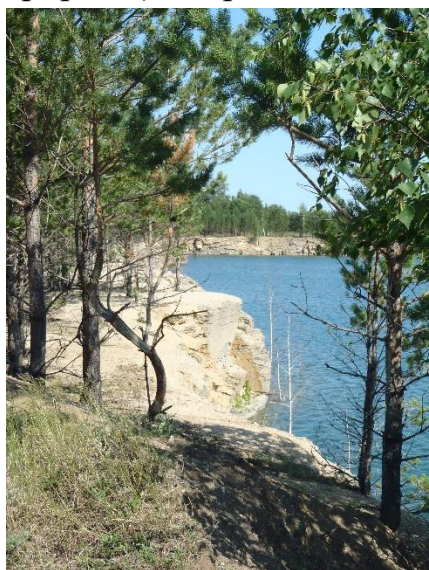
«Джабык Карагайский бор»

на поверхность скальных пород (пласты – геологический памятник природы) и Джабык–Карагайский бор, составная часть Анненская Копь (геологический памятник природы), озеро Безымянное (гидрогеологический памятник природы).