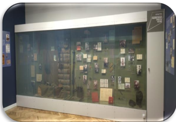
Интерактивные экспозиции музея