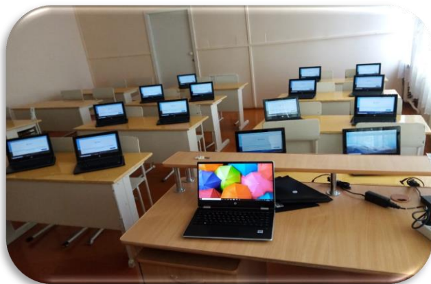
Региональный проект «Современная школа»