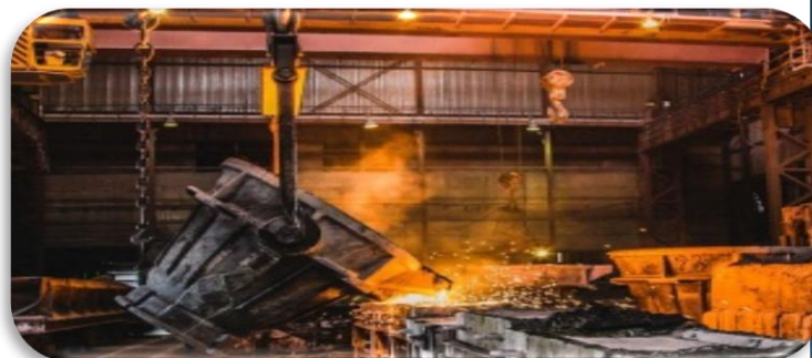
ООО «Златоустовский металлургический завод»

Старейшее предприятие по производству специальных марок стали и сплавов, имеющих повышенные прочностные и пластические свойства при низких и высоких температурах, стойких к щелочам и кислотам, предназначенных для холодной высадки и горячей обработки, автоматных марок стали с регламентированными механическими свойствами и стали со специальными свойствами