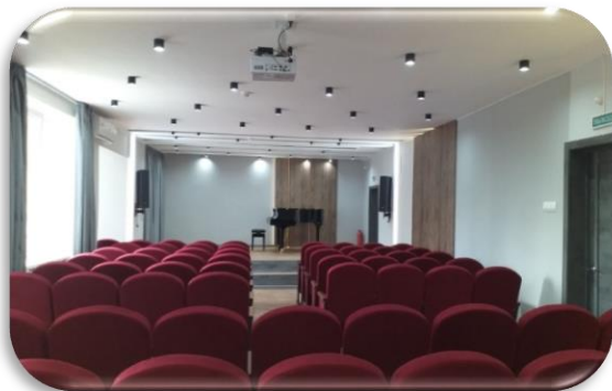
Виртуальный концертный зал