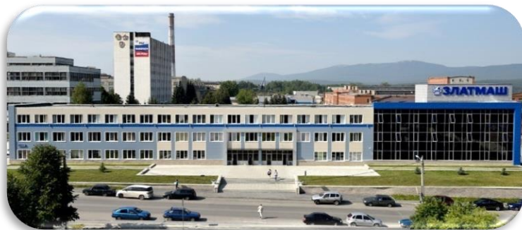
АО «Златоустовский машиностроительный завод»

Предприятие входит в структуру ГК «Роскосмос». Одно из ведущих изготовителей ракетных комплексов стратегического назначения ВМФ РФ и самое крупное по Челябинской области по объемам государственного оборонного заказа. Успешно развивается выпуск гражданской продукции.