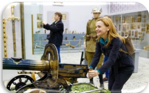
Музей-арсенал Златоустовской оружейной фабрики (ООО «ЗОФ»)