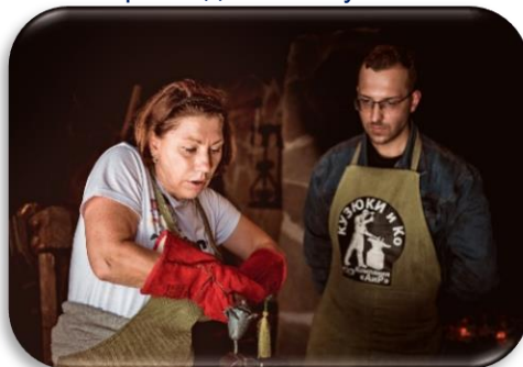
Оружейная слобода «АиРовка» (ООО «Компания «АиР»)