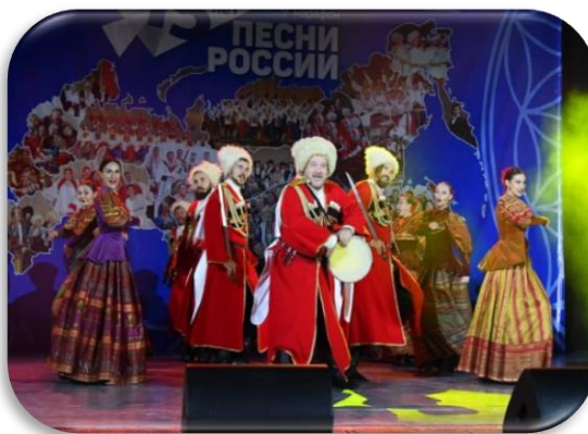
Фестиваль «Песни России»