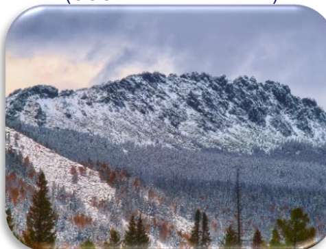
Национальный парк «Таганай»

472 тысяч человек - туристический поток за 2024 год.