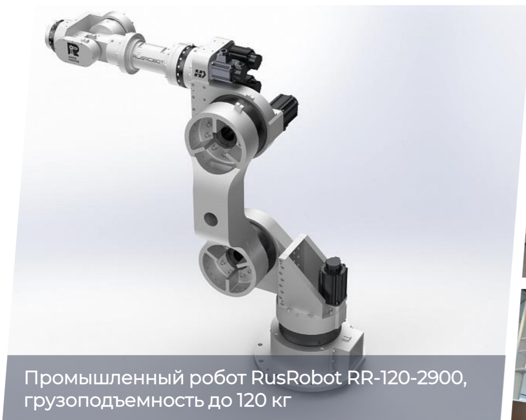
Промышленный робот RusRobot RR-120-2900, грузоподъемность до 120 кг