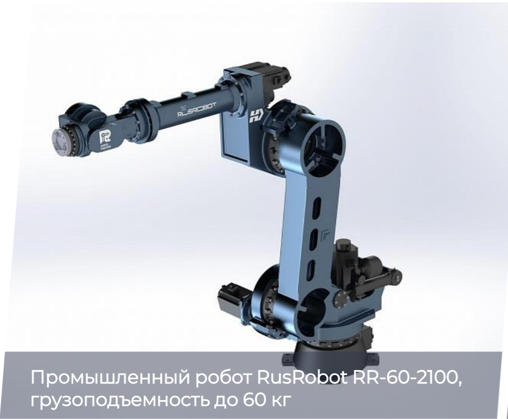
Промышленный робот RusRobot RR-60-2100, грузоподъемность до 60 кг