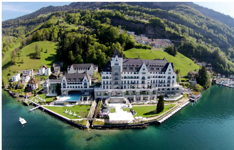
Парк-отель Vitznau, Швейцария