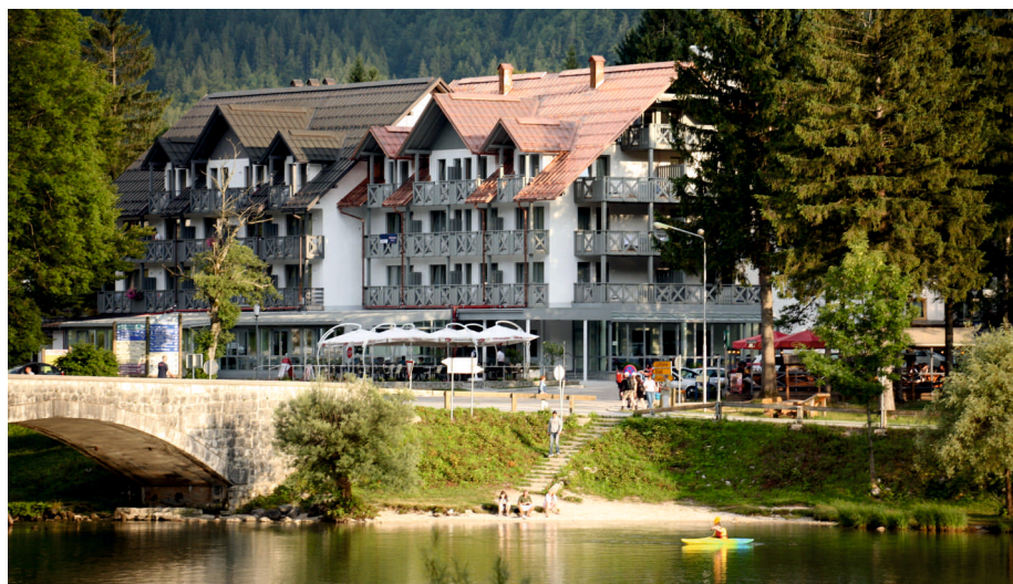
Отель Jezero, Словения

Описание предполагаемого инвестиционного проекта Строительство отеля под международным или федеральным сетевым брендом вместимостью более 120 номеров с открытым термальным бассейном. Возможно льготное финансирование в рамках Национального проекта «Туризм и индустрия гостеприимства».