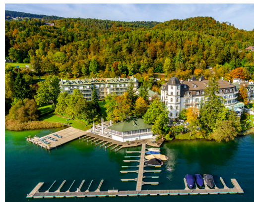
Спа-отель Schloss Seefelds, Австрия