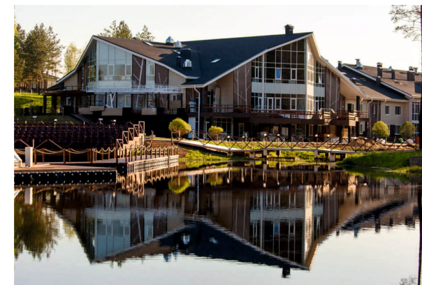
Парк-отель Доброград 4*, Владимирская область