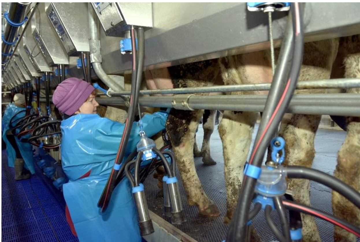
Рисунок 2: Оператор машинного доения в КХ "Карсакбаев К.Б."

На протяжении последних лет в области идет целенаправленная работа по увеличению валового производства молока, продуктивности животных. Сделана ставка на строительство с господдержкой новых молочных комплексов. В 2021 году в Агаповском районе в фермерском хозяйстве «Карсакбаев К.Б.» построена новая ферма на 516 мест с родильным отделением на 323 места и доильно-раздойным блоком на 40 мест (Рисунок 2).