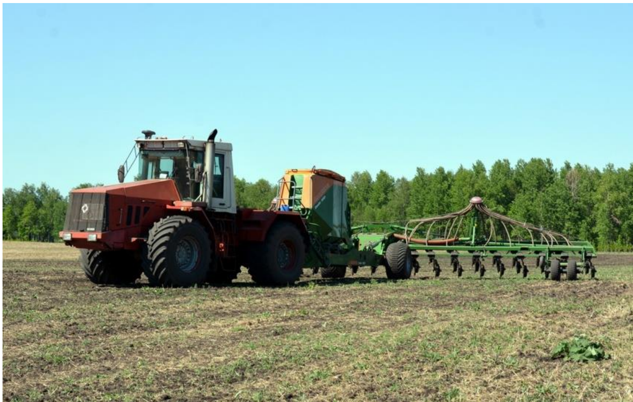
Рисунок 5: Весенний сев в ООО "Чебаркульская птица"

полноправными участниками всех работающих в регионе программ господдержки, а также получают целевую поддержку. В 2021 году на развитие семейных ферм из федерального и областного бюджетов выделено 52 млн рублей, гранты получили 6 хозяйств. Гранты «Агростартап» предоставлены 20 фермерскими хозяйствам на общую сумму 55,5 млн рублей. Семь сельскохозяйственных потребительских кооперативов получили субсидии на возмещение части затрат, связанных с закупкой сельскохозяйственной продукции, на общую сумму 10,2 млн. рублей.