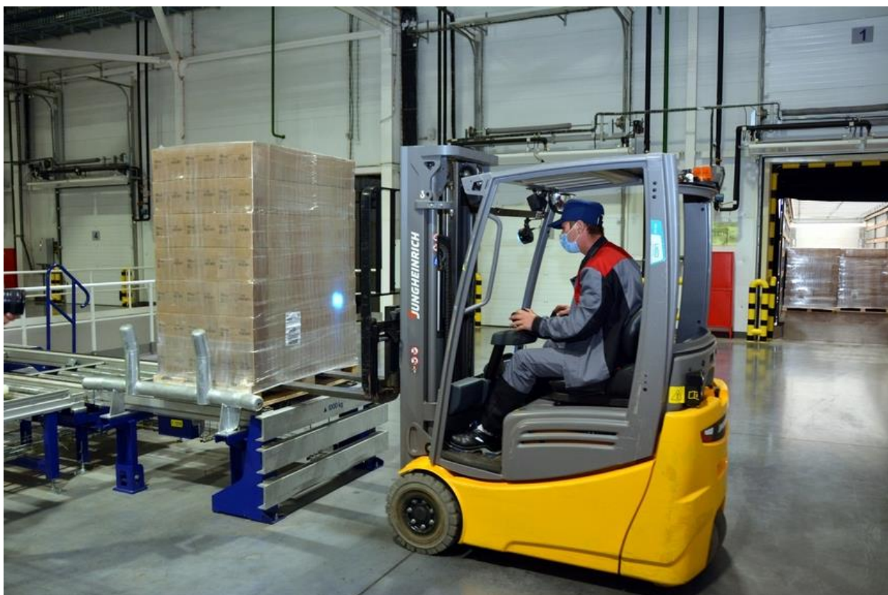
Рисунок 4: Погрузка продукции в ПЛК ООО "Ресурс"

производственно-логистический комплекс компании «Ресурс», инвестиции составили 5 млрд рублей (Рисунок 4). В производственно-логистический комплекс включён завод по производству модифицированных овсяных хлопьев мощностью 60 тыс. т. Производство практически полностью экспортноориентированное, сегодня это самая крупная площадка по переработке овса в России и в Европе.