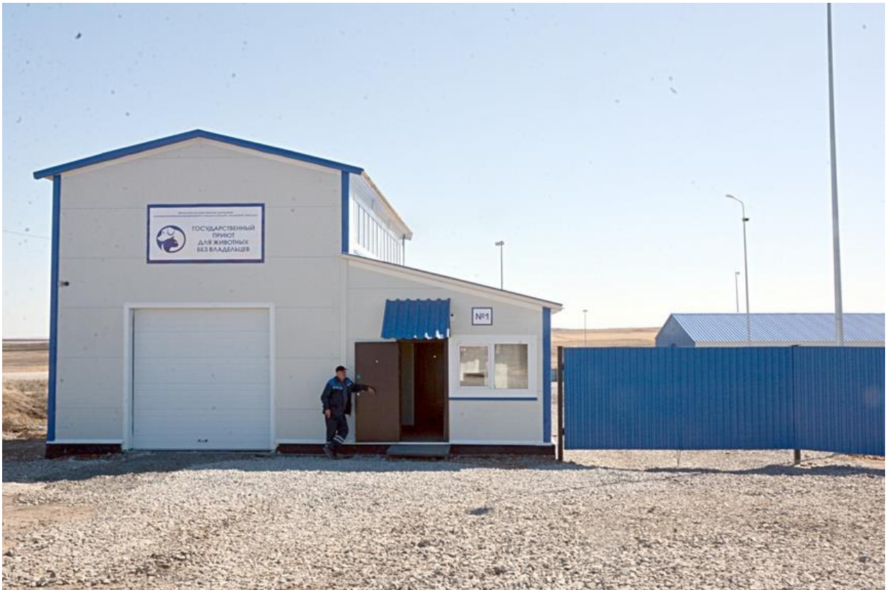
Рисунок 7: Государственный приют для животных без владельцев в Агаповском районе

В соответствии с законом «Об ответственном обращении с животными» в 2021 году в области заработал первый государственный приют на базе Агаповской ветстанции (Рисунок 7), на содержание в нем животных без владельцев направлено 15,8 млн. рублей, в 2022 – 2024 г. планируется создать подобные приюты в Сосновском и Катав-Ивановском районах. Муниципалитетам на организацию отлова животных и их содержание в приютах в 2021 году из областного бюджета выделено 30,8 млн рублей. Частным приютам на содержание животных без владельцев выделена субсидия в общем объеме 2 млн. рублей.