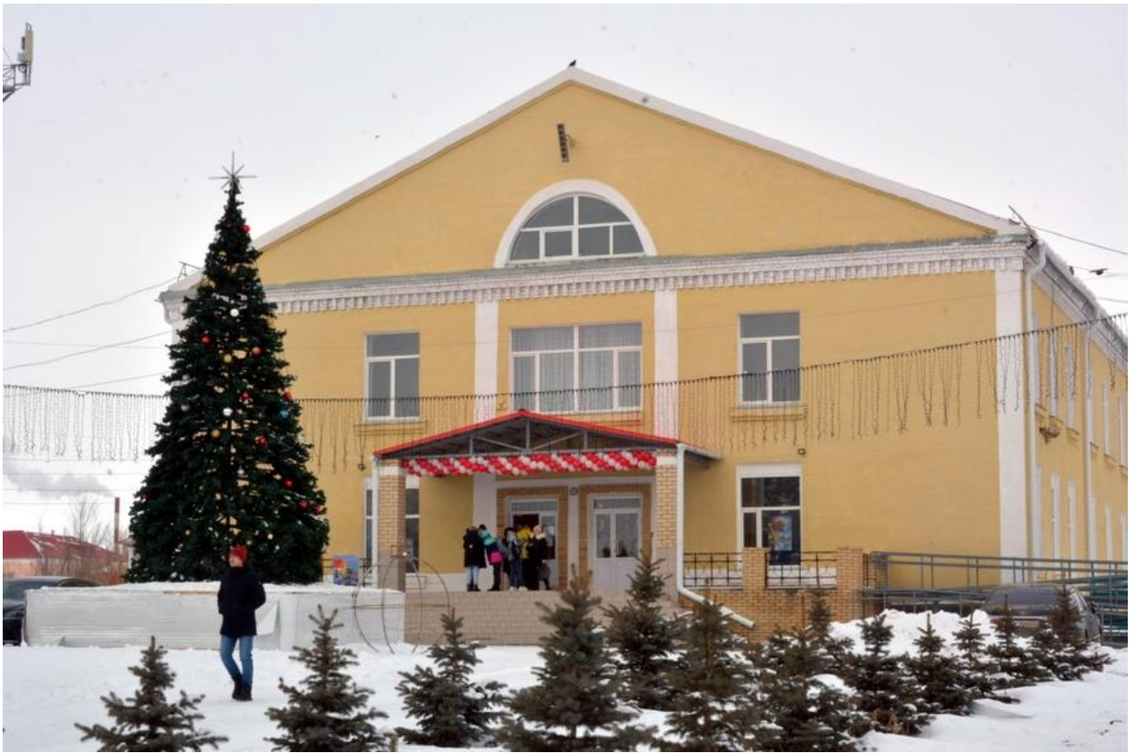
Рисунок 6: Районный Дом культуры в посёлке Бреды

292 млн рублей в 2021 году направлено на реализацию программы «Комплексное развитие сельских территорий в Челябинской области». Благодаря этой программе жилищные условия улучшили 54 сельские семьи. Введено в эксплуатацию 8,3 км автомобильных дорог. В сельских районах капитально отремонтировано или построено 16 объектов: отремонтированы три Дома культуры, три спортивных зала в школах и один спортзал в клубе, кровли в двух детских садах, в библиотеке и в четырёх школах, приобретён автобус для одного из Домов культуры, завершено строительство культурно-досугового центра в комплексе с блочной котельной (Рисунок 6).