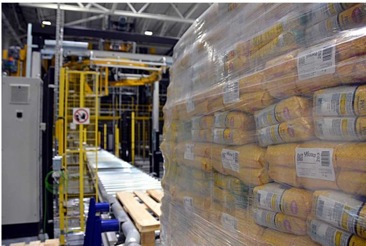
Рисунок 1: Продукция ООО "Ресурс", ТМ Увелка

Благодаря этой стратегии Челябинская область входит в первую десятку регионов России по производству мяса птицы, свинины, куриных яиц. На первом месте – по производству макаронных изделий. Челябинская область – крупнейший экспортер муки, круп, макарон, кондитерских изделий и подсолнечного масла (Рисунок 1).