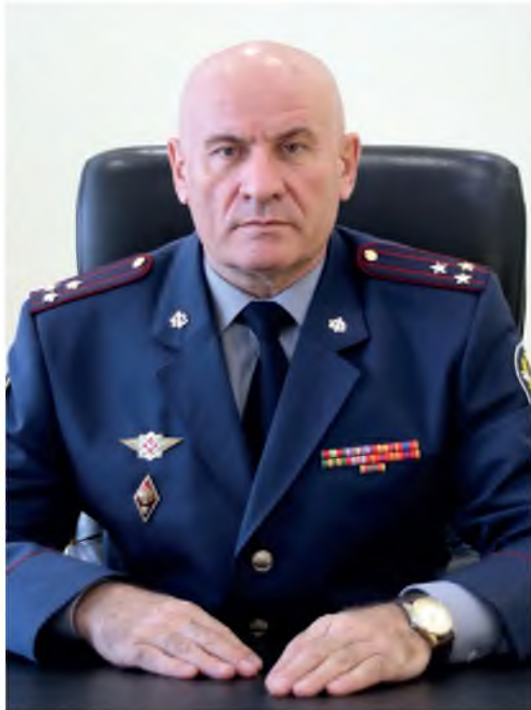
Начальник ГУФСИН России по Челябинской области полковник внутренней службы